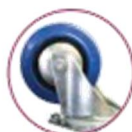
Roue non tachante

Notre gamme de rouleurs se compose de 42 références